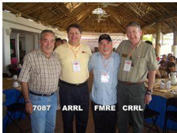
Presidentes de: 7087 -ARRL- FMRE-Canadá