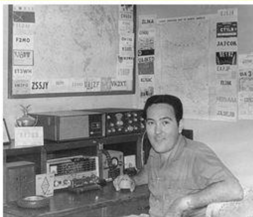
En su shack de XE2QQ