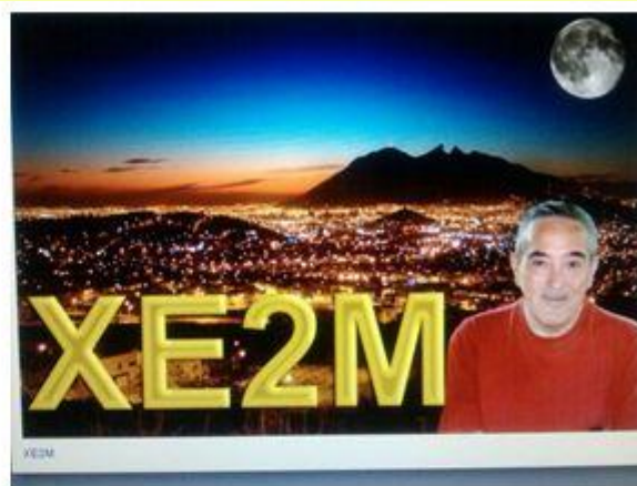
Su más reciente QSL.